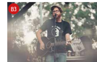
THE BLACK ELEPHANT BAND

In den Sommerferien 1982 gingen sie zum ersten Mal mit der traditionellen Tanz- und Kirchweihmusik auf Straßenmusik-Tour. Seitdem haben die Fränkischen Straßenmusikanten unzählige Auftritte gespielt – weit über Franken hinaus.